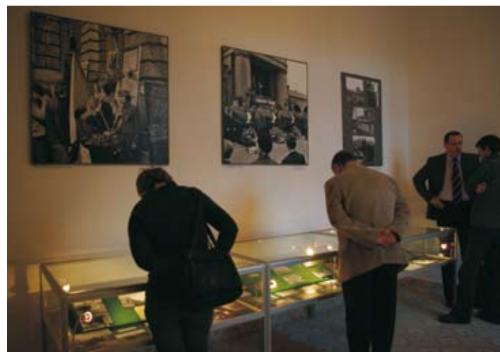
Zahájení výstavy Inwazja na Czechoslowacjie w 1968 r. – Karkonosze, Góry Izerskie i Północno-Wschodnie Czechy, Archiwum państwowe, Wrocław – Odział w Jeleniej Górze, 2. 12. 2008.

I přes tento pokrok nám v dokumentaci událostí souvisejících s rokem 1968 zůstávají mnohé mezery. Zejména pro období následujícího roku a počátku normalizace nám chybí doklady. Do budoucna bychom proto rádi doplnili zatím velmi skromný soubor vzpomínek těch, kteří jsou ochotni se o své osobní prožitky podělit a zaznamenat je pro budoucnost.