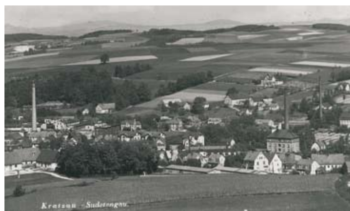
Zatím jediná známá fotografie koncentračního tábora FAL Kratzau II (r. 1944), kterou objevil badatel a spolupracovník muzea Pavel Štekl.

V současné době pracujeme na přípravě knihy, která se bude zabývat regionální historií táborových komplexů z období první a druhé světové války a z období odsunu německého obyvatelstva z českého pohraničí. První světová válka bude v knize zastoupena obrovským zajateckým táborem, který stál na místě dnešního libereckého letiště. Největší díl publikace věnujeme období druhé světové války. Koncentrační tábory, pobočky kmenového tábora Groß-Rosen, budou mít samostatné kapitoly a poprvé budou zpracovány zcela detailně. Každý objekt bude přiblížen plánovou dokumentací jak původní, tak i novou, která ostatně bude provázet i další typy táborových zařízení v knize uvedené. Zároveň budou známá fakta doplněna o závěry z výzkumů v terénu a o donedávna neznámé podrobnosti odhalené při archivních šetřeních. Podobně pojaty budou i kapitoly o druhoválečných zajateckých a pracovních táborech a odsunových střediscích. Některá zařízení máme doložena jen ve svědeckých výpovědích nebo naopak