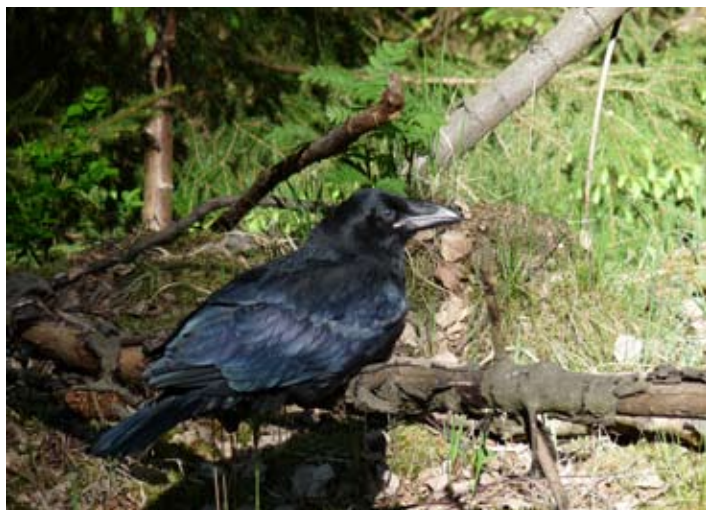
Krkavec velký hnízdí řídko, ale plošně po celém Frýdlantsku. Tento „mládík“ se vylíhl v hnízdě nedaleko Pertoltic.

nem. Je odsud známo nemnoho starších literárních údajů zejména z první třetiny 20. století. Teprve v 80. letech se začala objevovat první pozorování napovídající, že tato část libereckého okresu skrývá po stránce zoologické mnoho