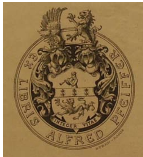
Ex libris Alfreda Pfeiffera.

domácí knihovně měla. Pouze u jedné z takto označených knih však můžeme s jistotou říci, že ji Alfred Pfeiffer do muzea věnoval, u ostatních je jejich cesta do muzejních sbírek zatím nejasná. Knihy tvoří zajímavý celek a dokládají sběratelský zájem Alfreda Pfeiffera o francouzské tisky 17. a 18. století. Dnes se již pravděpodobně nepodaří zrekonstruovat knihovnu tohoto sběratele. Nemůžeme ani s jistotou říci, zda knihy, které se dnes nalézají ve sbírkách Severočeského muzea, tvoří vrchol jeho sbírky nebo jsou jen jejím torzem. S jistotou však můžeme tvrdit, že se o tisky zajímal a že tyto soubory mědirytin se dochovaly díky jeho sběratelské vášni a také díky Severočeskému