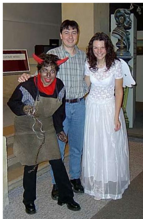
Z mikulášské nadílky v Severočeském muzeu, r. 2005.