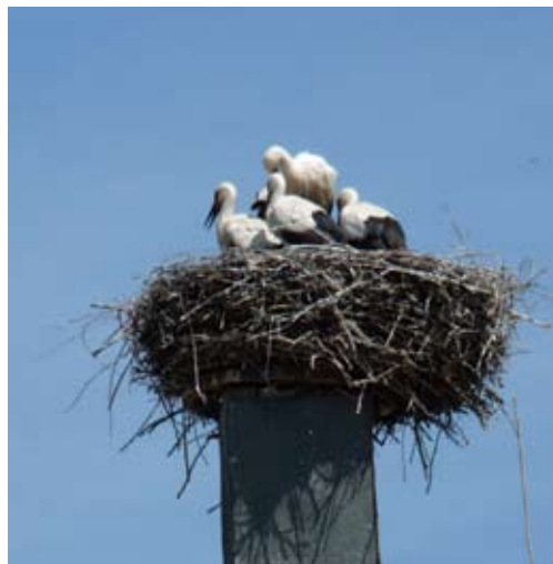
Čáp bílý zde patří k pravidelně hnízdicím druhům. Sčítání je díky jeho vazbě na lidská sídla poměrně jednoduché.

Pro mapování hnízdního rozšíření ptáků Frýdlantska je využívána kombinace výše uvedených metod. Ta byla dosud využita pouze na Třeboňsku. Tato metoda předpokládá, že celé území bude rozděleno na cca 140 mapovacích čtverců o ploše přibližně 2 km 2 . V každém čtverci je umístěno 10 sčítacích bodů. Na těchto bodech probíhají v hnízdní době dvě sčítání. Dále je v každém mapovacím čtverci provedeno mapování druhů obtížně zachytitelných výše uvedenou bodovou sčítací metodou. Jedná se zejména o sovy, dravce, chřástala polního a vodní ptáky. Tímto způsobem by měla být zachycena podstatná většina hnízdicích druhů, a to na poměrně husté síti čtverců, to znamená dostateč-