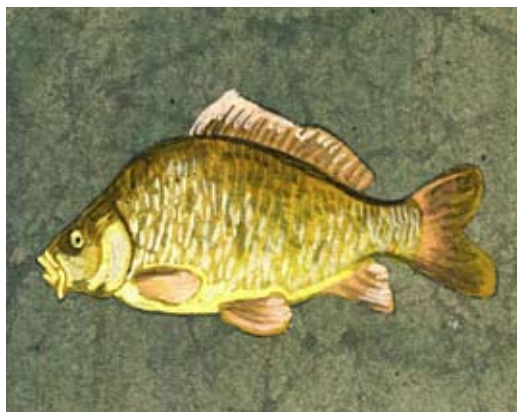
Ilustrace Tomáše Řízka z knihy Český rok od jara do zimy.

zásadní důležitosti, neboť symbolizovala díky velkému množství zrněk bohatství (především vzhledem k penězům), se řadila sladká prosná kaše nebo jahelník a třený mák s mlékem. Proto se proso udrželo ve svátečním jídelníčku všech významných dnů v roce, i když je ani chuť uzeleného, se kterým se později vařilo, neproměnila v oblíbený pokrm. Neodmyslitelnou součástí štedrovečerní tabule zůstala dodnes vánočka z kynutého těsta a jablečný závin.