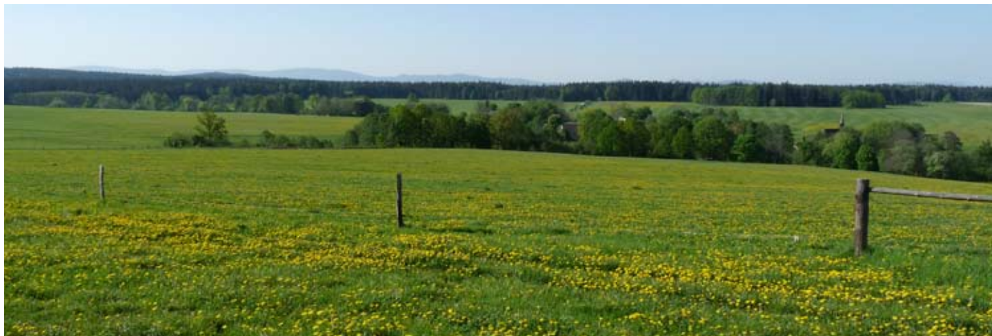
Pastviny u Dolní Oldříše představují charakteristický biotop krajiny Frýdlantska. Jedná se o hnízdiště mnoha lučních a polních druhů. Tato skupina ptáků patří v současnosti k nejohroženějším.

Mapovací práce vyžadují zkušenosti s touto metodou. Na Liberecku bohužel není dostatek takto zkušených ornitologů, proto se do terénních prací zapojují ornitologové doslova z celé České republiky. A právě nedostatečný počet odborníků zapříčinil zdržení celého mapování, které bude muset být oproti původním předpokladům dokončeno až v příštím roce. Poté budou výsledky zpracovány a publikovány. ■