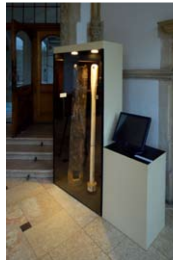
Vystavené zbytky pumpy z dolu Zeche.

Návštěvníci, kteří přišli do muzea na začátku října, si mohli všimnout několika změn. Ve vstupním vestibulu vyrostla nová vitrína s podivnými dřevy. Je to první vlašťovka spolupráce SM a České speleologické společnosti ZO 4–01 Liberec a ona „dřeva“ jsou zbytky důlní pumpy z Kryštofova údolí z roku 1704. Slavnostní vestibul byl naopak zahalen do mlhy igelitové fólie, neboť tu probíhala obnova původní podlahy, tzv. terrazzo. A čekají nás i změny podstatné. Již v roce 2012 začne obměna stálé expozice. Prvním krokem bude vytvoření hudebního salonu s interaktivní prezentací mechanických hudebních automatů. ■