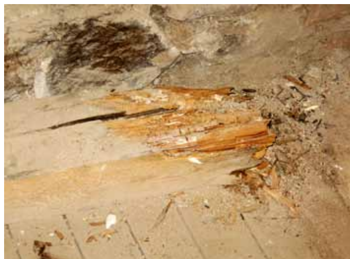
Obr. 2: Zhlaví trámu zcela zničené dřevomorkou