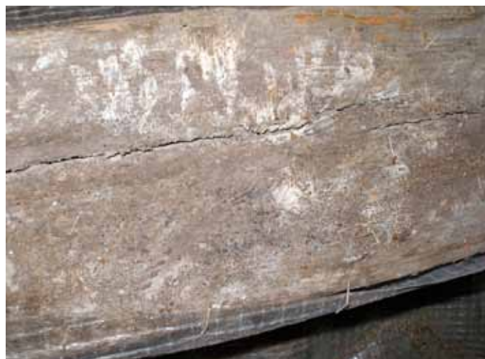
Obr. 4: Porost mycelia dřevokazné houby na povrchu dřevěného trámu