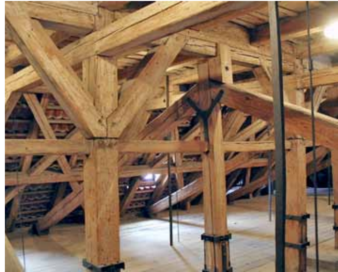
Obr. 10: Historický krov z masivních prvků v památkově chráněném objektu

objektů, např. činžovních domů, veřejných budov, historických objektů, statků atd.). Prohlídka se provádí především smyslovými metodami za použití jednoduchých pomůcek, např. přenosné světlo, délková měřidla, lupa, nůž nebo dláto, kladívko nebo sekerka, pilka, vrták (lesnický – přírůstkový, kterým se získá celistvé jádro), fotoaparát atd.