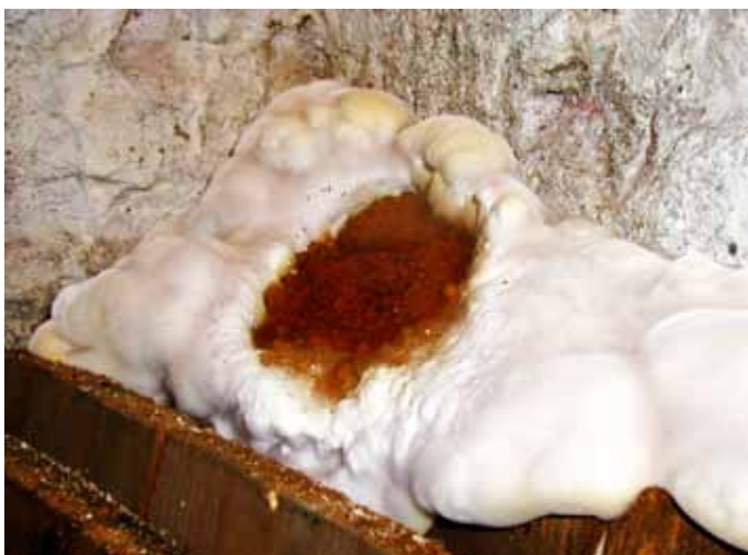
Obr. 1: Typická aktivní dřevomorka domáci

Dřevěné konstrukce se v průběhu času více nebo méně rychle opotřebovávají, nejčastěji