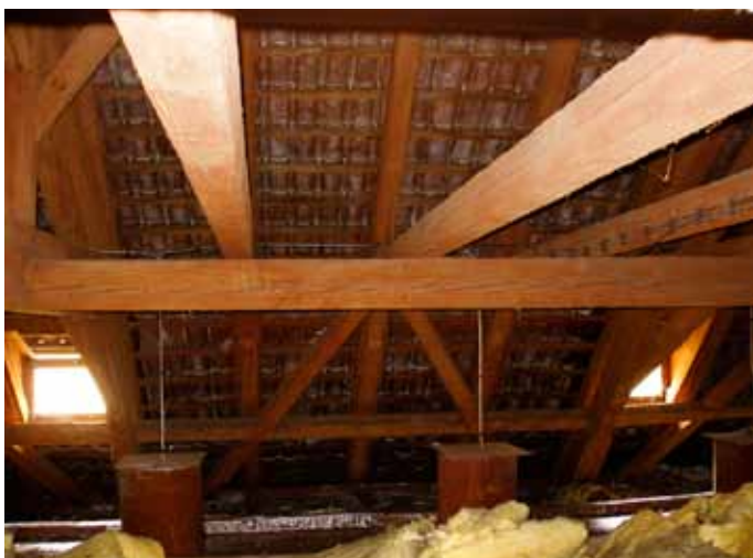
Obr. 3: Krov Nosticovy haly připravený k mykologickému průzkumu, odkrytá zhlaví trámů