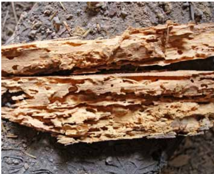
Obr. 7: Destrukce dřeva larvami tesaříka krovového