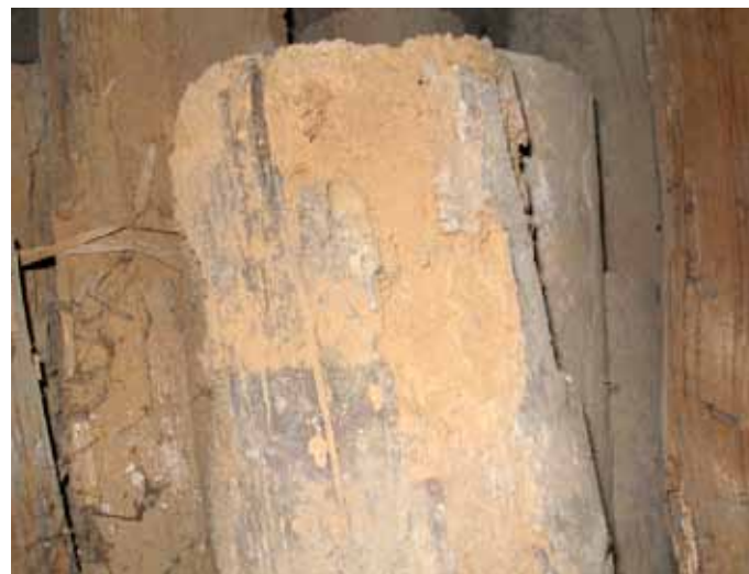
Obr. 6: Intenzivní hloubkové poškození trámu dřevokazným hmyzem

působením biotických škůdců, působením povětrnostních vlivů (u krovů pouze nepřímým, způsobujícím zvlhnutí dřeva), ale nezřídka rovněž „zásluhou“ samotného člověka (zanedbáním pravidelné péče a údržby). Bez ohledu na to mnoho dřevěných konstrukcí (krovů) přežilo už více než jedno století a dnes jsou mnohé z nich začleněny do fondu kulturních památek. Pro každou civilizovanou společnost by péče o ně měla být samozřejmostí.