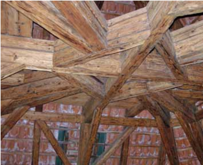
Obr. 9: Historický krov Černé věže Pražského hradu