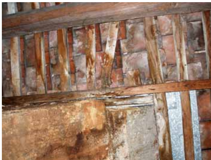
Obr. 5: Zatékání střechou a zlomení latě vlivem napadení dřevokaznou houbou