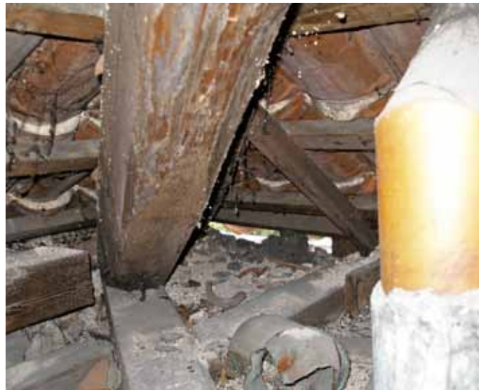
Obr. 8: Zbytky stavebního materiálu v prostoru krovu

v půdním prostoru – zatékáním srážkové vody při poruchách střešního pláště, vzlínáním kapilární vody při poruchách hydroizolace stěn a/nebo při aplikaci paronepropustných nátěrů na špatně odizolované stěny, nedostatečným a/nebo nesprávným odvětráváním půdního prostoru (kondenzace vody), lokální změnou vnějšího klimatu v bezprostředním okolí budovy (např. zastínění vzrostlými stromy) apod.