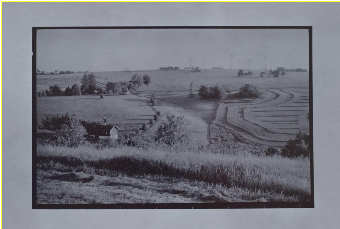
Fotografický papír Foma Neobrom doporučený spotřebovat do 4/1990 (skladovaný při pokojové teplotě) vyvolaný běžnou pozitivní vývojkou.