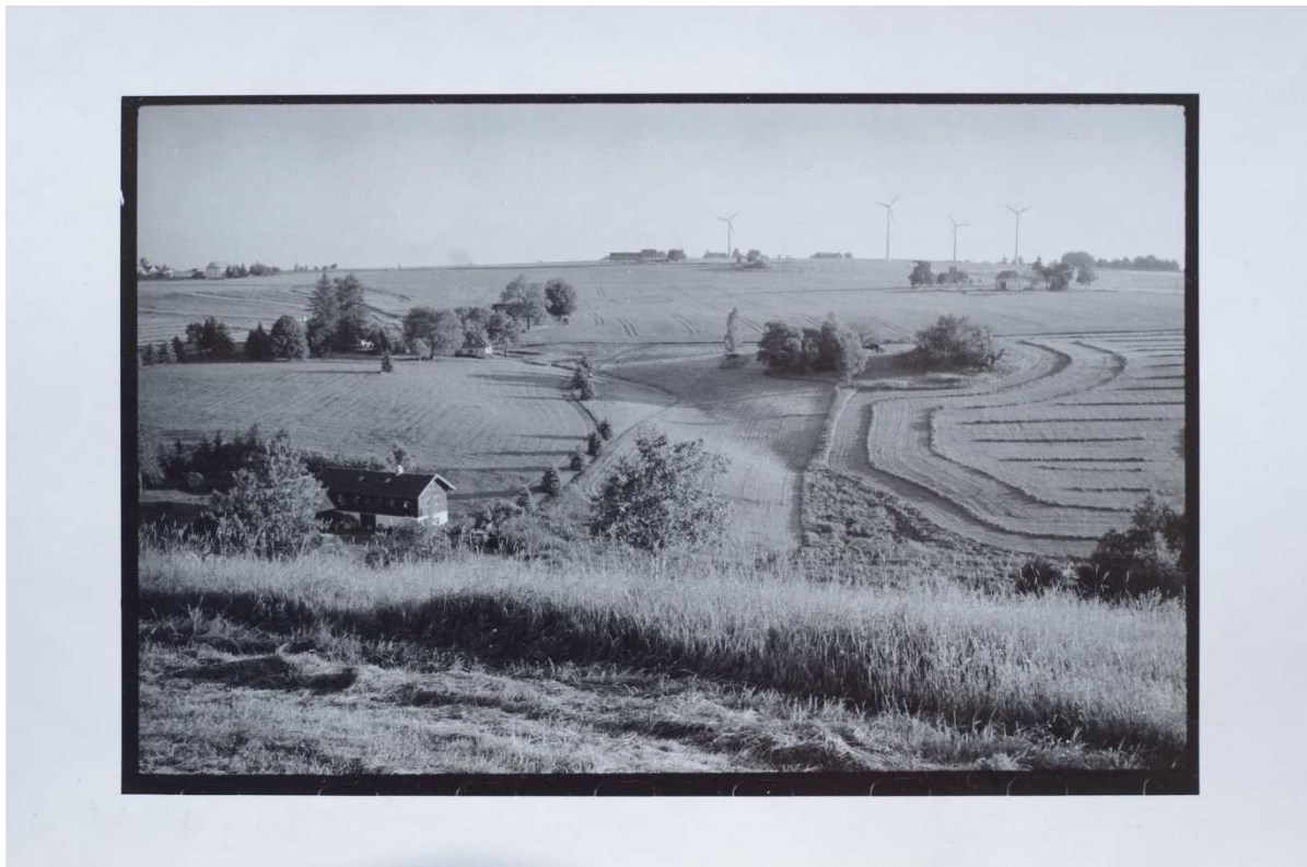
Tentýž fotografický papír vyvolaný v metol-pyrokatechinové vývojce s přidavkem benztriazolu, při teplotě 17 °C.